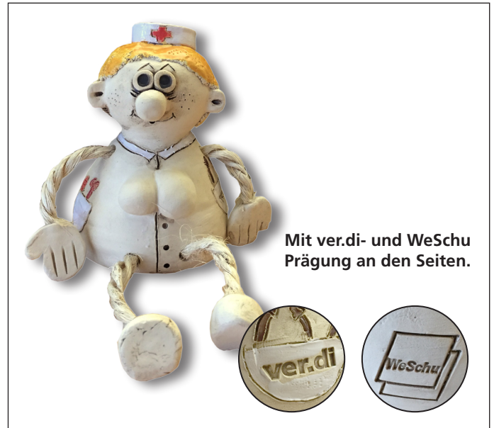
Mit ver.di- und WeSchu Prägung an den Seiten.